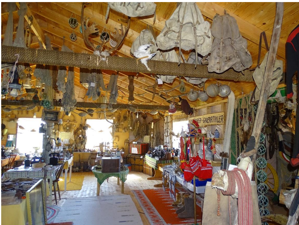
Oversiktsbilde av deler av gjenstandssamlingen.