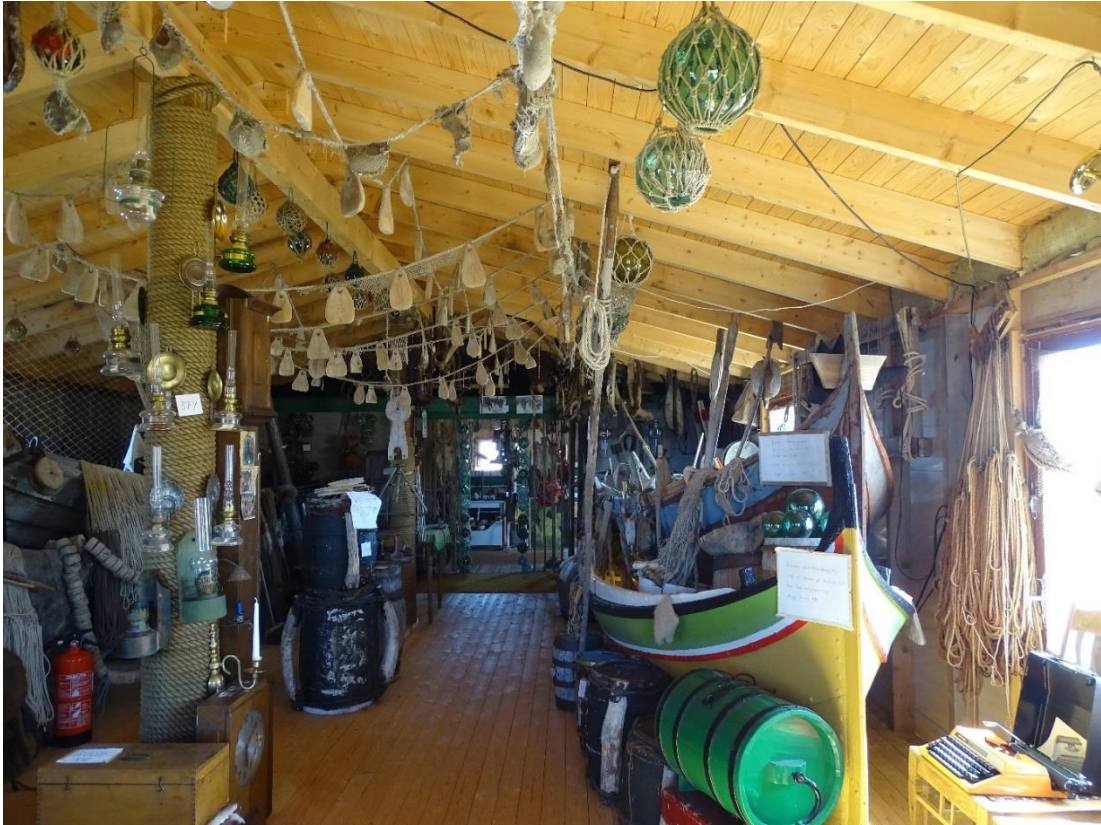
Oversiktsbilde av deler av gjenstandssamlingen.