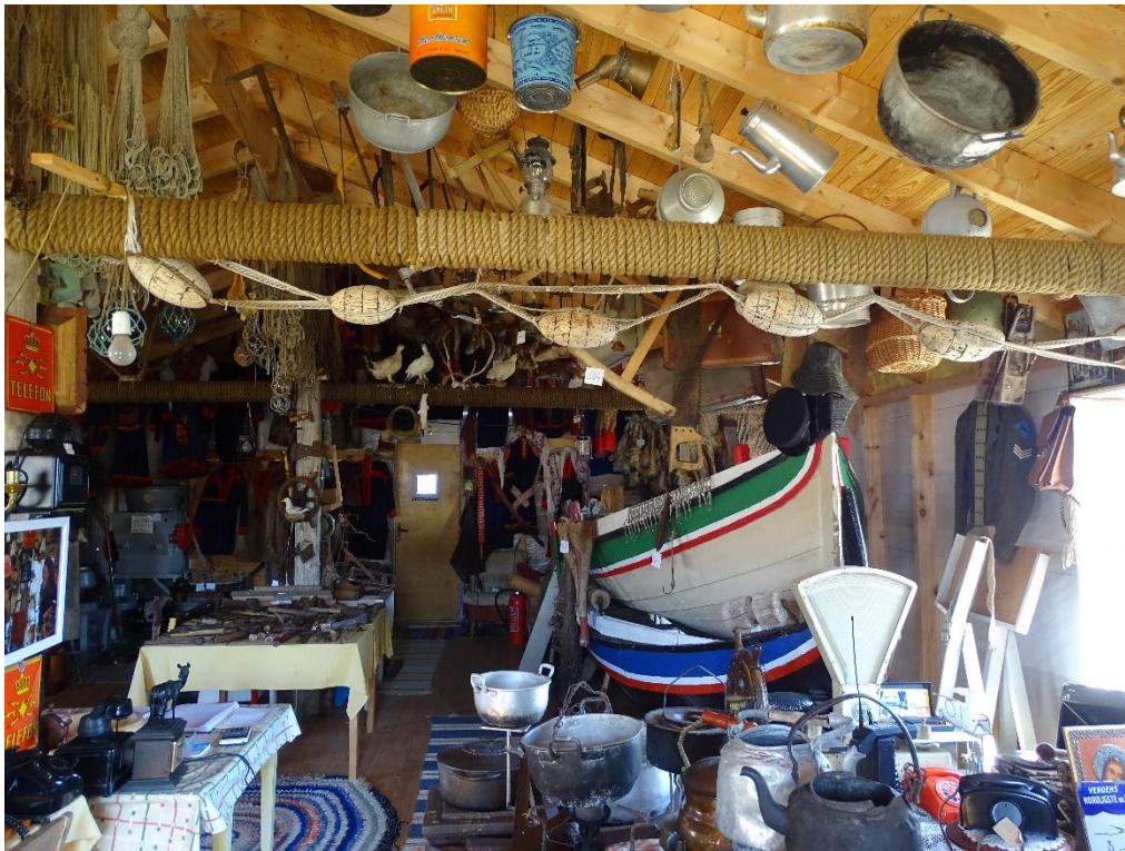
Oversiktsbilde av deler av samlingen.