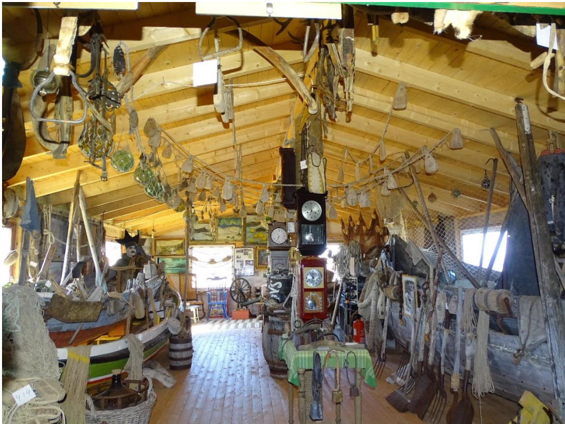
Oversiktsbilde av deler av gjenstandssamlingen.